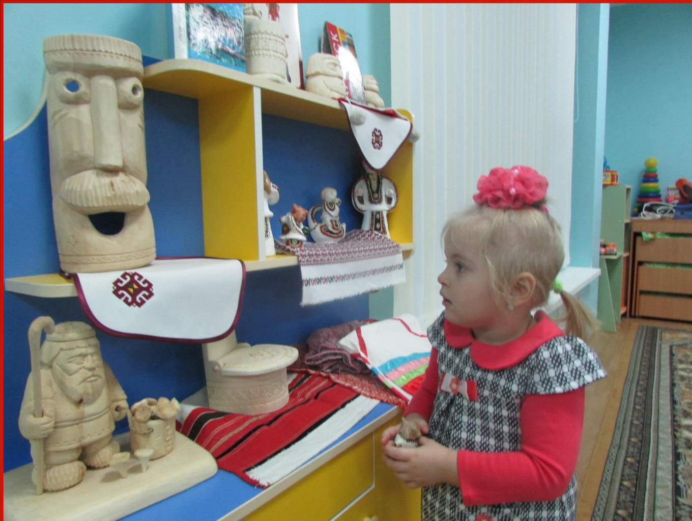
Уголок национальной культуры во второй младшей группе № 1