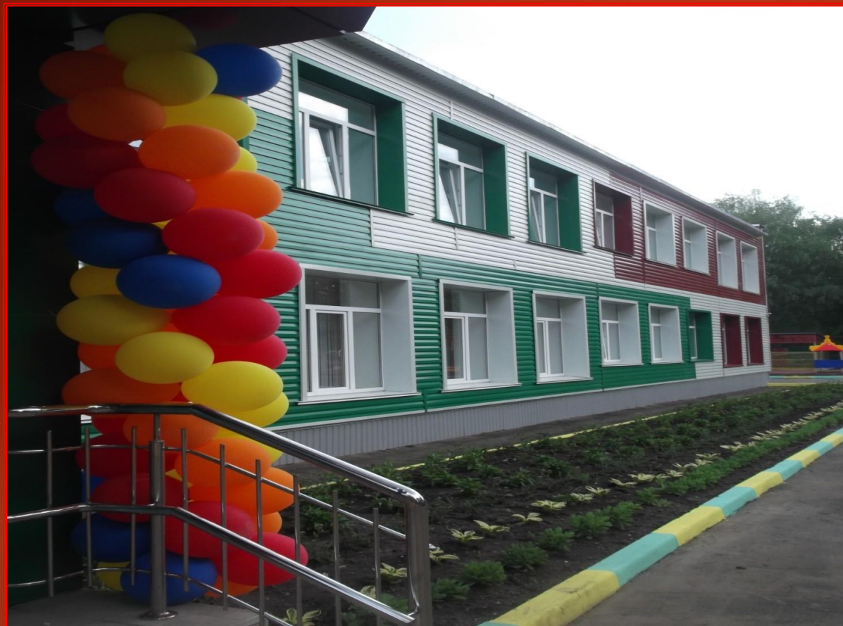
МАДОУ «ДЕТСКИЙ САД № 59», Республика Мордовия, г.Саранск