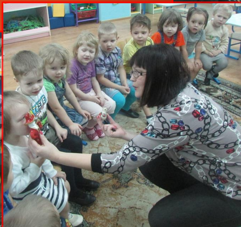
Совместный с ГБУК «Мордовская республиканская детская библиотека» досуг «Мордовские сказки и игрушки»