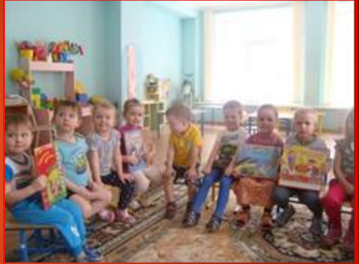
Комплексное занятие «Музыкальные книжки»