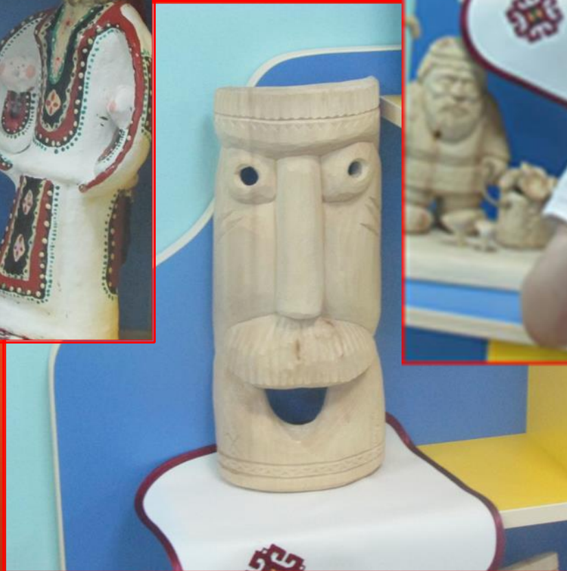
Работы мастера, подаренные воспитанникам