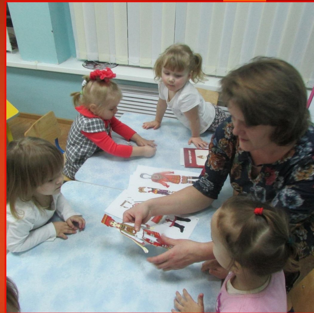
Совместная деятельность воспитателя и детей с объектами уголка национальной культуры