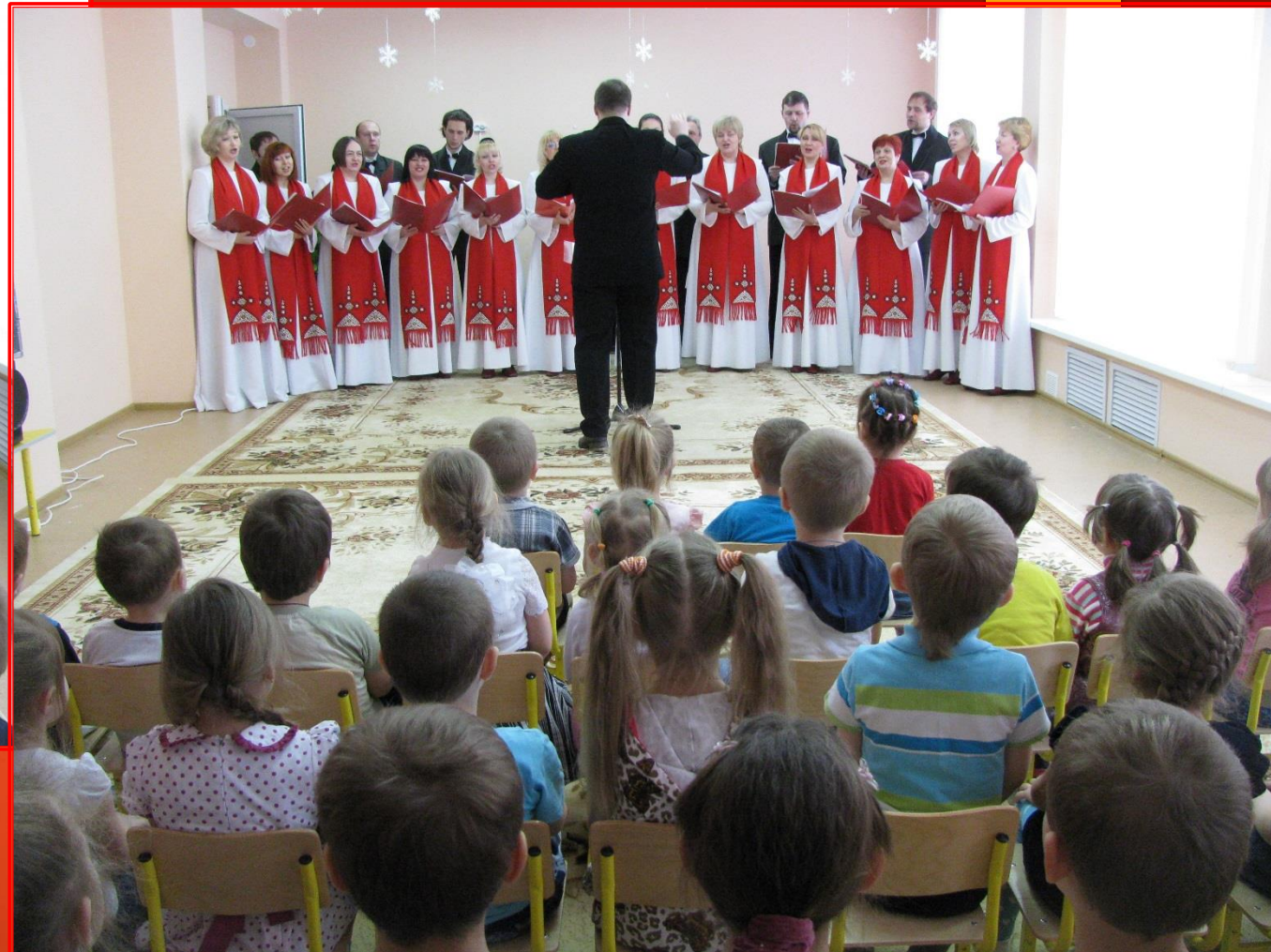
Выступление ГБУК "Государственный камерный хор Республики Мордовия" в детском саду